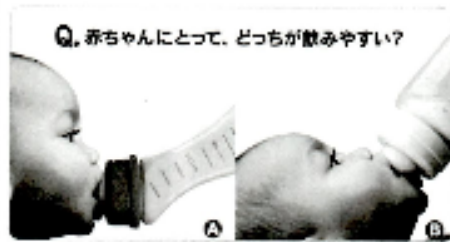
Q. 赤ちゃんにとって、どちらが飲みやすい？

不適切な姿勢は腹式呼吸・鼻呼吸に悪影響を及ぼすため、立つために必要な抗重力筋の成長にも影響を及ぼし、全体重を支える人間の土台となる足指、足裏の変形まで影響すると考えます。赤ちゃんは1日の多くを抱っこされた状態や寝て過ごします。そのため抱っこの仕方や寝方はとても重要となるのです。